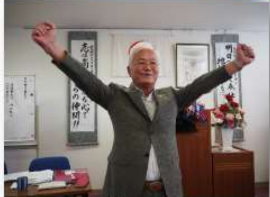
ライオンズローア