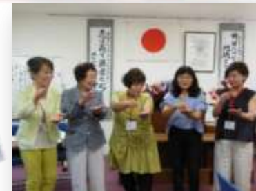
ライオンズ・クエスト・薬物乱用防止委員会メンバーが前に出て手遊び ♪いっぽんぽし♪を