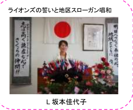
ライオンズの誓いと地区スローガン唱和