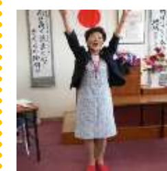
ライオンズ・ローア