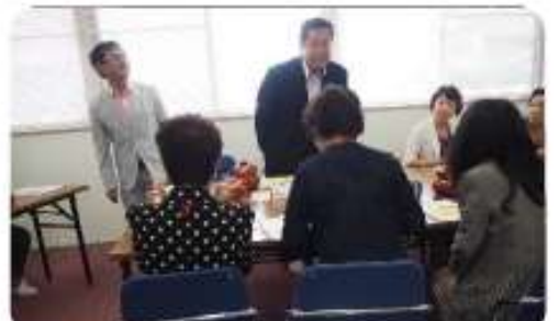
春日井けやき LC から make-up にみえたお二人