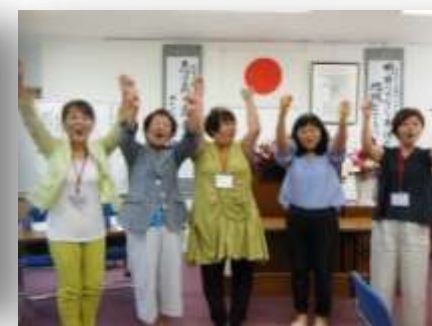
ライオンズローア