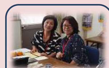
テールツイスター