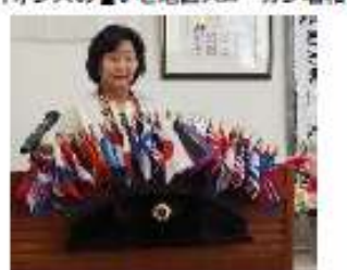
ライオンズの誓いと地区スローガン唱和