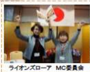
ライオンズローア MC委員会