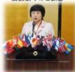
会長新年のご挨拶