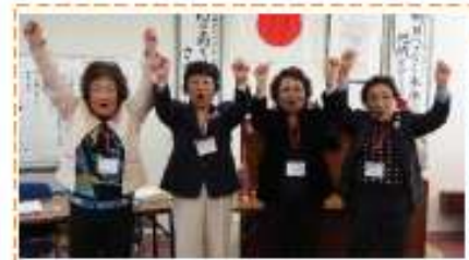
ライオンズローア 新入会を祝して