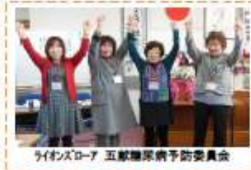
ライオンズローア 五臓健康病予防委員会