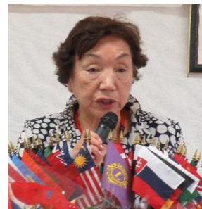
ライオンテーマー