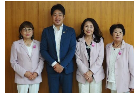
犬山市長 山田拓郎様