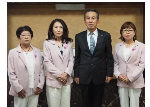
扶桑町長 千田勝隆様