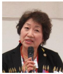
6R マーケティング コミュニケーション委員長

6R マーケティングコミュニケーション委員長 全国さくらフォーラム委員長 新役員・理事 挨拶