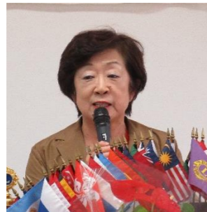
ライオンズクエスト・ 薬物乱用防止委員長