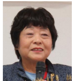
テールツイスター