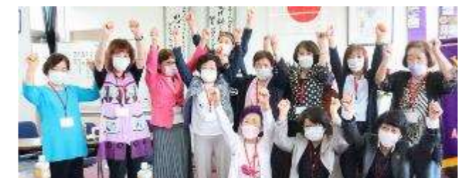
<ライオンズローア> SAKURA フォーラム参加者の皆さん