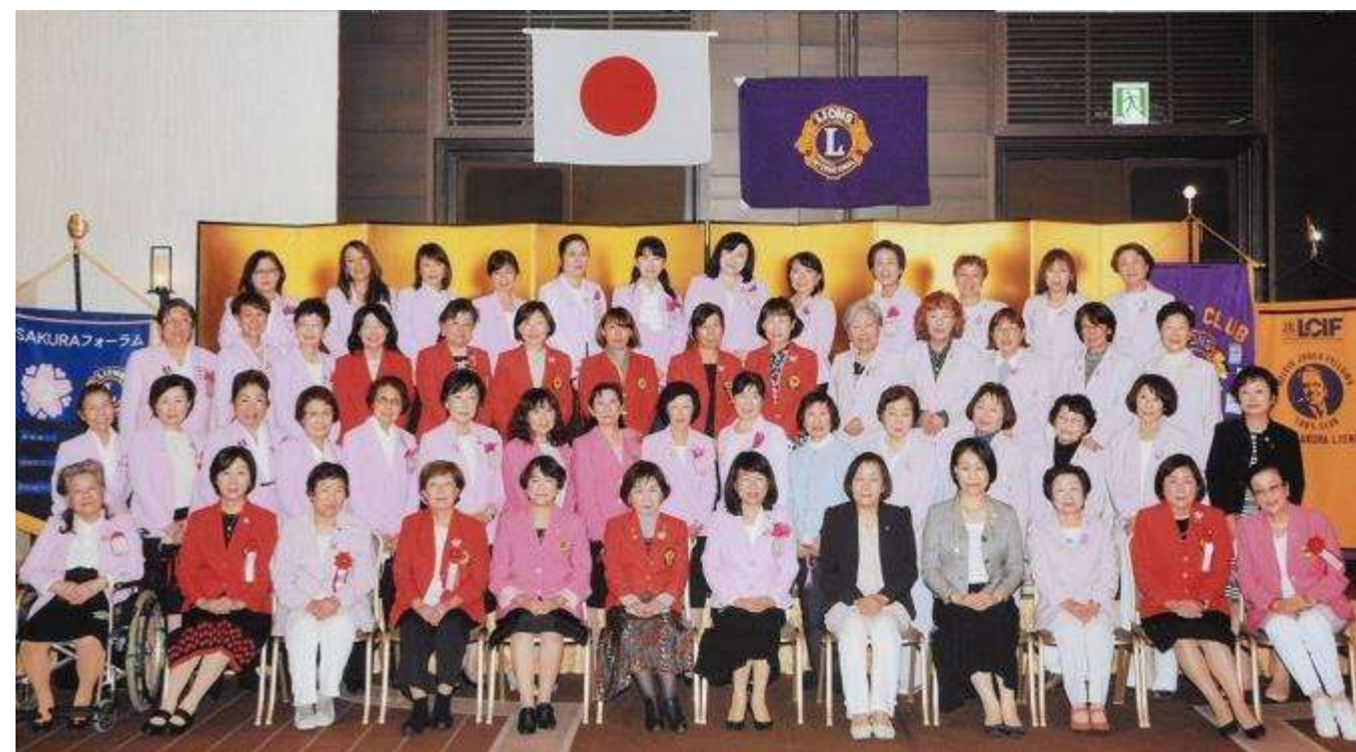
第 19 回全国 SAKURA フォーラム in 福岡