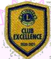
2020-2021年度の クラブ優秀賞を いただきました！