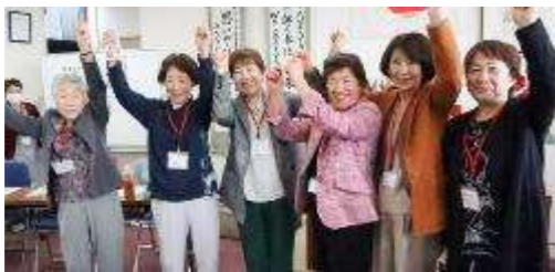
<ライオンズローア> YCE・レオ委員会の皆さん